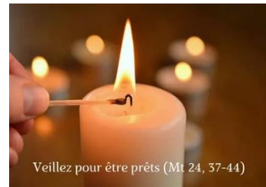
Veillez pour être prêts (Mt 24, 37-44)