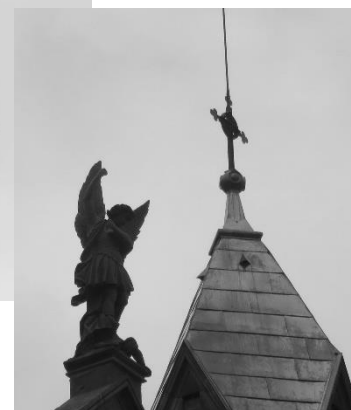
6 Juin : Bénédiction de la statue de St Michel et remise en place sur le pignon de la basilique