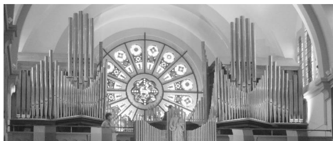
6 Juin : Bénédiction de l'orgue