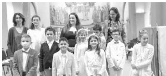
6 Juin : 1ère Communion