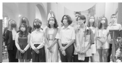
30 Mai : Confirmation