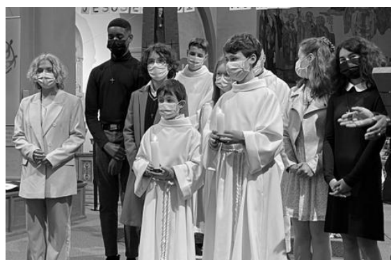
24 Mai : Profession de foi